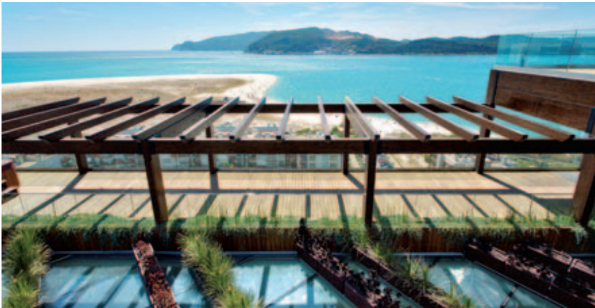
O ambiente romântico de Tróia é uma das nossas sugestões, mas o amor também bate à porta no resto do País

RYANAIR COM BILHETES LISBOA-PORTO A €7,99